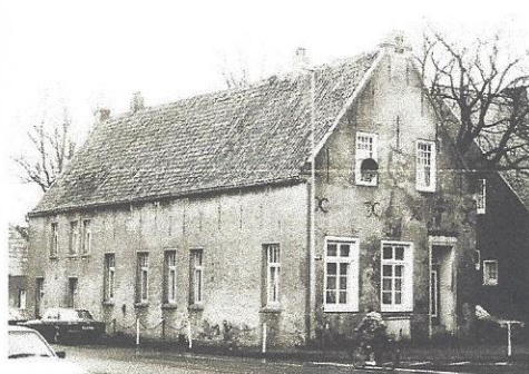
Seit 2008 ist die Bürgerstiftung Norden Eigentümer des Bürgerhauses.

sen, Graf Tido, soll Bauherr um 1550 gewesen sein. Doch die Anfänge sind verworren. Auch ein Junker, mit dem die Adelsfamilie im Clinch lag und der wohl auch in kriminelle Machenschaften verworren war, soll zwischenzeitlich Besitzer