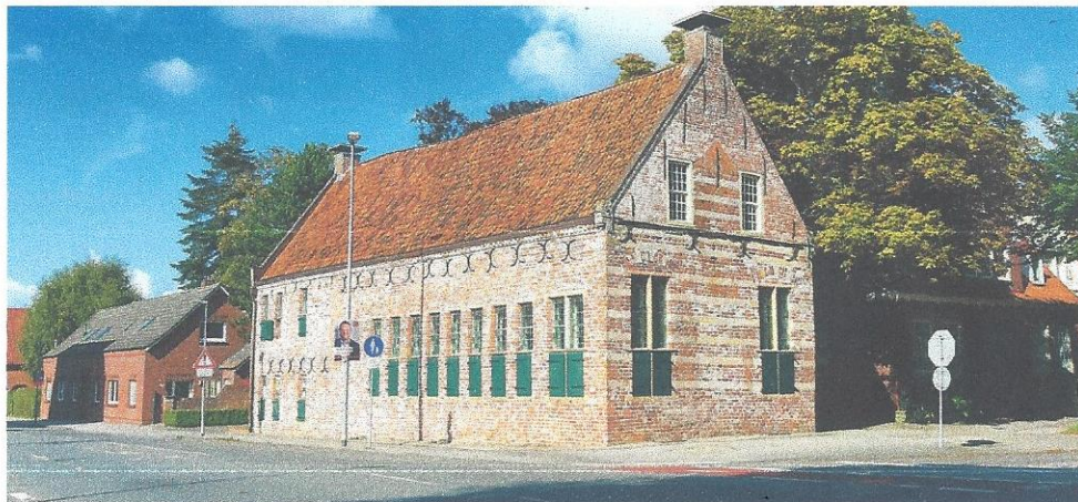
Seit der Sanierung 1994 erstrahlt das Bürgerhaus wieder in voller Pracht.

Über Jahrhunderte besaß das Adelsgeschlecht Inn- und zu Knyphausen das Bürgerhaus und nutzte es als Stadthaus. Somit beherbergte das Bürgerhaus auch Sprösslinge der ostfriesischen Häuptlingsfamilien, die sich mit den Inn- und Knyphausen durch Heirat verbanden. Doch nicht nur zahlreiche Bräute aus den ostfriesischen Dynastien, auch bürgerliche sah das Haus in