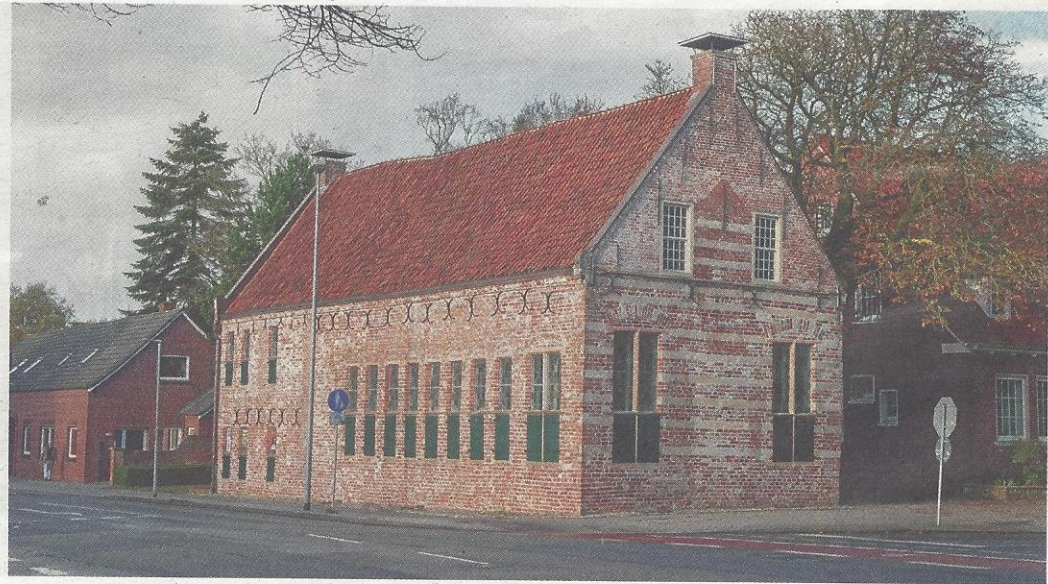
Im Bürgerhaus wird Mitte November der Stiftungspreis verliehen.